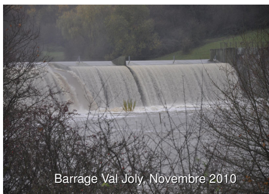
Barrage Val Joly, Novembre 2010

Les dossiers ont été transmis à 25 services et aux 19 communes début Janvier 2011. Le délai limite de réponse était de 2 mois .