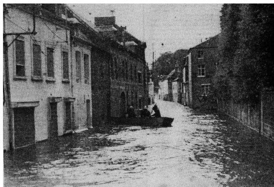
Avesnes sur Helpe, Juillet 1980